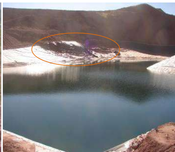
Se observa deterioro de la geo-menbrana protectora del suelo del dique de colas - foto tomada en agosto 2010

Por otra parte, las familias de las comunidades Calari Chico, Ninoka Chico y Huayojtata, vienen siendo testigos de la constante disminución de su producción agropecuaria, por la presencia de polvo y residuos químicos que se utilizan en la planta 71 . Las y los comunarios comentan que la producción forrajera y la pradera natural ha disminuido afectando en el peso de los animales, las ovejas pierden su lana, la reproducción de los animales está siendo afectada (pariciones antes de tiempo o con deformaciones) y la muerte de los mismos es cada vez más frecuente. Así mismo, la pérdida en la capacidad productiva de sus tierras, está afectando los cultivos tradicionales de quinua, cañahua, papa, cebada cada vez con menor producción, atentando no solo contra la seguridad alimentaria de las comunidades del Jach'a Suyu Pakajaqi, sino, también contra la salud de las personas que están siendo afectadas con frecuentes infecciones en los ojos, la piel y los pulmones, por la constante presencia de polvo y otros elementos de olores penetrantes que se dispersan en el aire y contaminan el medio ambiente de las comunidades. Las y los comunarios, sienten y ven como se van empobreciendo a medida que la actividad minera avanza.