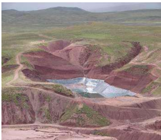
Dique de colas recién terminado. - foto tomada en febrero 2010