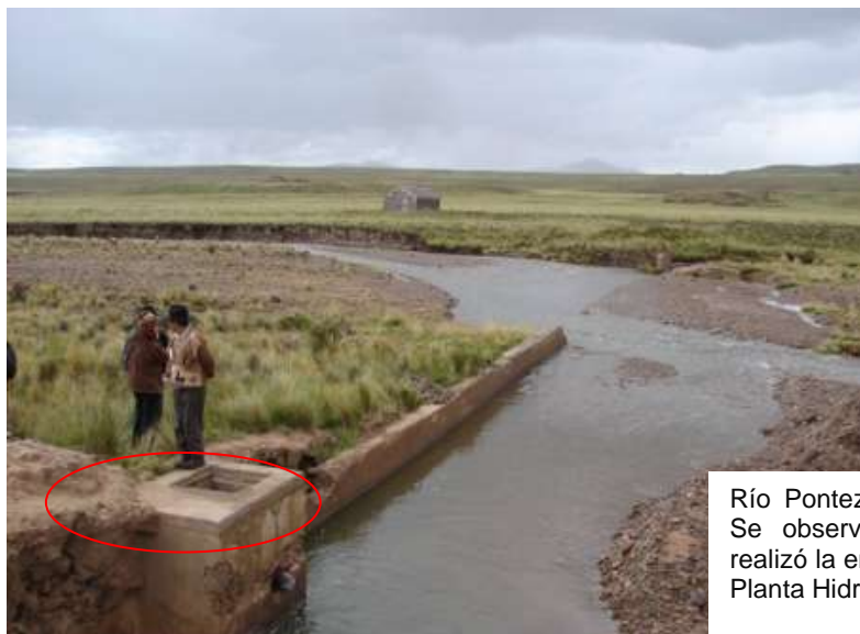
Río Pontezuelo, comunidad Sicuipata. Se observa el devío de agua que realizó la empresa para llevar agua a la Planta Hidrometalúrgica de Corocoro.

Así mismo, existe susceptibilidad en las comunidades que después del proyecto, las fuentes de agua superficiales y subterráneas (vertientes, ojos de agua, ríos) desaparezcan o terminen siendo contaminadas por las actividades de producción y la permanente filtración de las aguas residuales de la planta hidrometalúrgica que se almacena en el dique de colas, que actualmente se encuentra en malas condiciones de funcionamiento 69 .