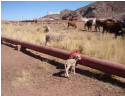
Ducto de agua para la planta, perjudica la crianza del ganado

Las familias indígenas Pakajaqis tienen derecho a vivir libremente en sus territorios que ancestralmente han ocupado y han sido transmitidos por generaciones. Al respecto, la Convención Americana sobre Derechos Humanos en su artículo 21 sobre derecho a la propiedad privada, que según una decisión de la Corte Interamericana de Derechos Humanos en el caso Mayagna (Sumo) comunidad Awá Tingni vs. Nicaragua de 2001, tiene un carácter colectivo en el caso de los pueblos indígenas; “considera que el artículo 21 de la Convención protege el derecho a la propiedad en un sentido que comprende, entre otros, los derechos de los miembros de las comunidades indígenas en el marco de la propiedad comunal” 46