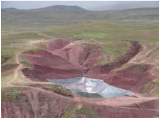
Dique de Colas" construido en tierras de pastoreo.