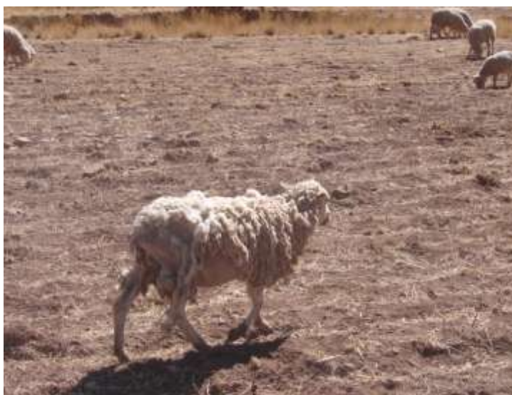
Oveja pierde lana, comunarios atribuyen los hechos a la posible contaminación de las aguas, presencia de polvo y restos tóxicos de la planta hidrometalúrgica.

Otros testimonios nos comentan al respecto: (...) nuestros animales se han afectado, ya se han enfermado, ya tres ovejas han muerto. Porque decimos que es producto de la contaminación, porque en este tiempo antes nunca se han muerto nuestras ovejas de