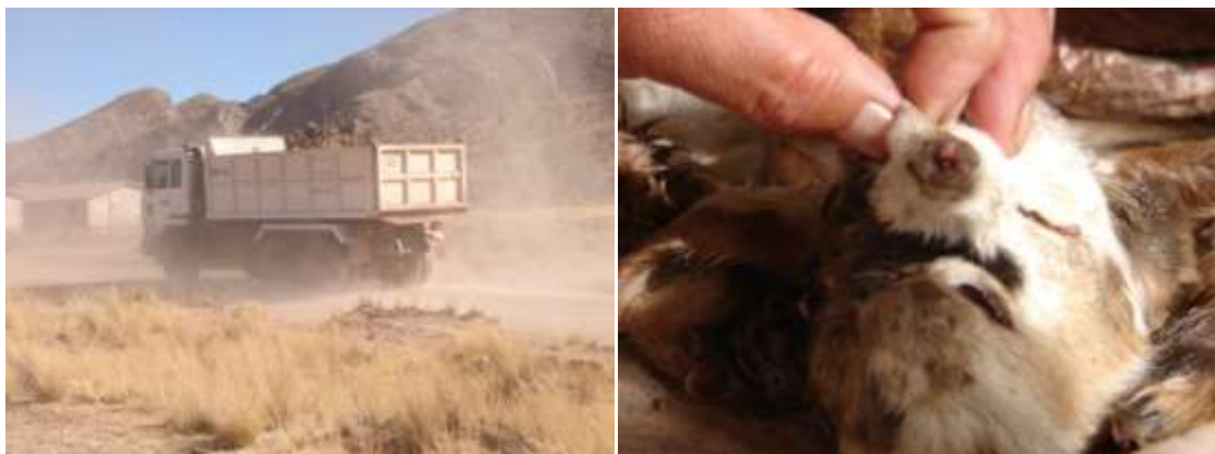
Presencia de polvo, volquetas con minerales pasan delante la casa de los comunarios. Foto tomada en agosto de 2010