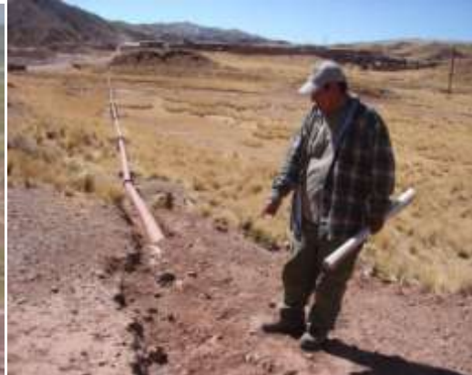
Ducto de agua para la planta, pasan por las tierras de pastoreo de la comunidad